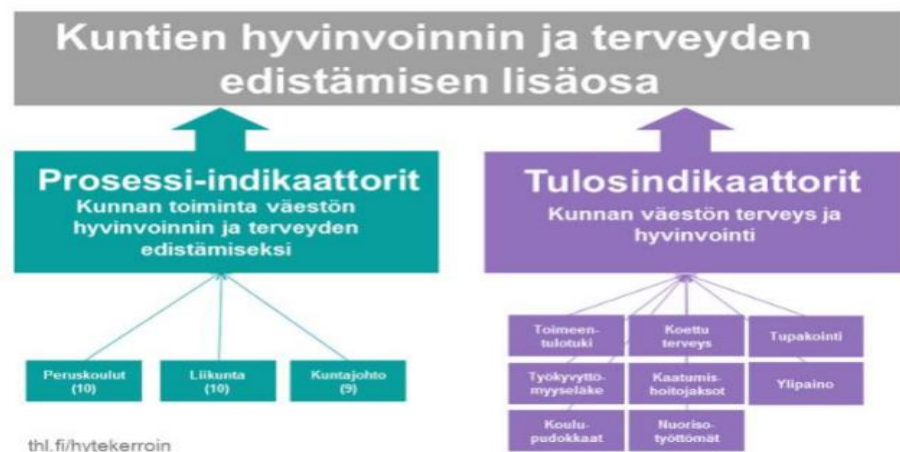
Kuva 1. HYTE –kertoimen laskennassa käytettävät indikaattorit.

Uudet hyvinvointialueet käynnistyvät 2023. Hyvinvointialueet tuottavat jatkossa sosiaali- ja terveys- sekä pelastustoimen palvelut. Hyvinvoinnin, terveyden ja turvallisuuden edistäminen jää kunnan poikkihallinnolliseksi tehtäväksi. Sen tehtävän hyvä hoito on vahvasti yhteydessä myös kunnan elinvoimaisuuden ja talouden kehitykseen. Jatkossa, hyvinvointialueiden toiminnan käynnistyessä, kuntien valtionosuusrahoitus tulee muuttumaan. 2023 alkaen kuntien valtionosuuden hyvinvoinnin ja terveyden edistämisen lisäosan laskennassa käytetään HYTE –kerrointa. Se tarkoittaa sitä, että jatkossa kunnan valtionosuuksien määräytymiseen vaikuttaa muiden tekijöiden ohella kunnan tekemä työ kuntalaisten hyvinvoinnin ja terveyden edistämiseksi. Kertoimen tarkoituksena on kannustaa kuntia aktiiviseen hyvinvoinnin ja terveyden edistämiseen myös hyvinvointialueuudistuksen voimaantulon jälkeen. HYTE -kerroin muodostuu neljästätoista (14) toimintaa kuvaavasta prosessi-indikaattorista sekä kuudesta (6) tuloksia kuvaavasta tulosindikaattorista (Kuva 1.)