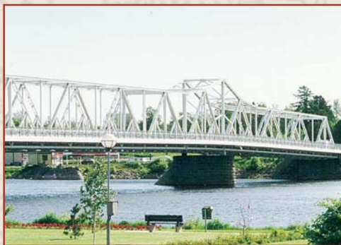
Hannulan silta v. 1939