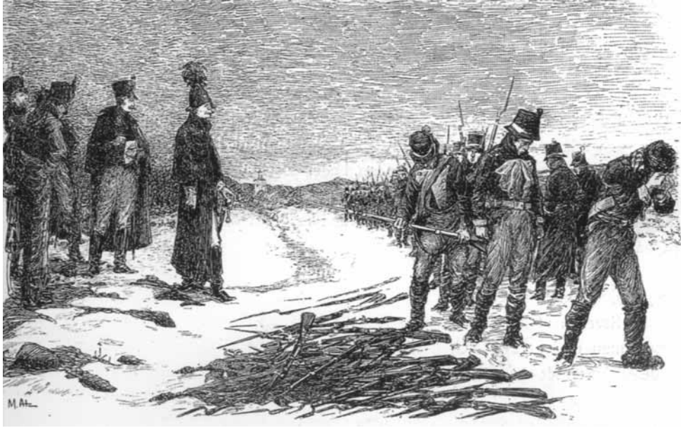
Kenraalimajuri Gripenbergin joukot laskivat aseensa Kainuun Månsbyssä 25.3.1809 kirjoitetun sopimuksen mukaisesti

Torniosta vetäytymisen jälkeen Ruotsin tilanne kävi yhä vaikeammaksi. Maaliskuussa 1809 venäläiset tunkeutuivat Ahvenanmaalle ja jäätyneen merenkurkun yli Uumajaan. Tukholmassa suoritettiin vallankaappaus ja kuningas Kustaa IV Aadolf joutui luopumaan kruunusta. Armeijan rippeet antautuivat Säivin kylässä 25.3.1809. Kenraalimajuri Gripenbergin tekoa pidettiin epäsotilaallisena, mutta se oli vallitsevissa kurjissa oloissa todennäköisesti ainoa oikea. Komentajan tiedossa oli venäläisten hyökkäykset Ahvenanmaalle ja Uumajaan sekä Tukholman vallankaappaus. Kainuun (Kalix) antautumista kutsutaan virallisesti aselevoksi tai sopimukseksi. Gripenberg neuvottelikin venäläisten puolelle jääneille sotilaille inhimillisen kohtelun ja vammojen hoidon. Suomessa kootut joukko-osastot saivat marssia aseineen ja lippuineen Tornion läpi ja luovuttivat aseensa vasta Kemin(maan) kirkolla.