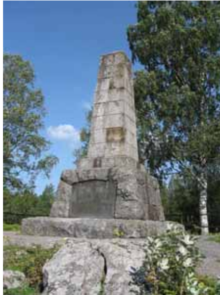
Suomen sodan ratkaisevin taistelu käytiin Oravaisissa 14.9.1808

Armeija alkoi vaikuttaa uupuneelta. Jatkuva marssiminen, keho ruoka ja syksyn kylmyys alkoivat tehdä tehtäväänsä. Useat olivat sairastuneet punatautiin. Sairaiden ja haavoittuneiden kuljetus oli vaikea järjestää ja monet jättäytyivät jälkeen, kun eivät enää jaksaneet.