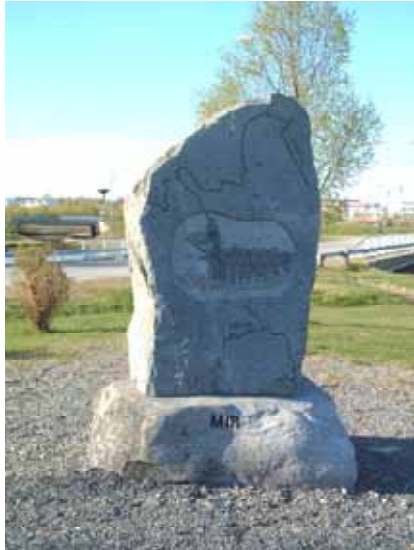
Haaparannalla sijaitseva vuoden 1808-1809 uhrien muistomerkki.

Nykyisen Ruotsin puoleiset sotilashaudat ovat tiedossa ja suurin osa vielä löydettävissäkin. Haaparannan sotilashaudoille on pystytetty tullipuistoon 1989 yhteinen sodan ja rauhan muistomerkki.