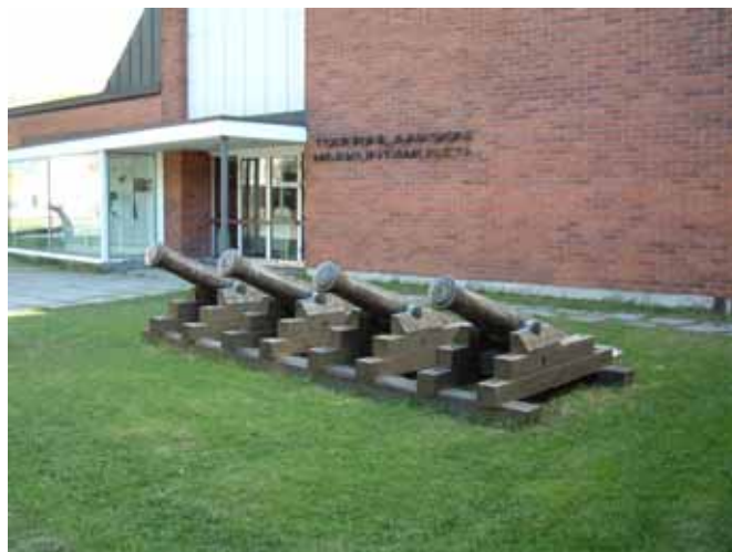
Tornion Röyttästä huhtikuussa 1970 löydettyjen tykkien arvellaan liittyvän Suomen sodan tapahtumiin. Ilmeisesti aseet oli tarkoitettu puolustamaan jokisuuta ja ne upotettiin mereen perääntymisvaiheessa.

Venäläiset sanoivat aselevon irti kenraali Schuvalovin kirjeellä, joka toimitettiin Pohjoisen armeijan komentajalle kenraali Hans H. Gripenbergille 18.3.1809. Sotatoimet alkaisivat neljän päivän kuluessa. Venäläisten ilmoitus tuli yllättäen, sillä aselevon piti kestää maaliskuun loppuun. Gripenberg ei saanut toivomaansa pidennystä aselevolle. Komentaja katsoi ainoaksi mahdollisuudeksi vetää joukot Kalixin suuntaan. Sairaat ja heikkokuntoiset sotilaat jätettiin Tornioon. Venäläiset joukot ylittivät Kaakaman aselepolinjan 23.3.1809 ja saapuivat vielä samana päivänä Tornioon.