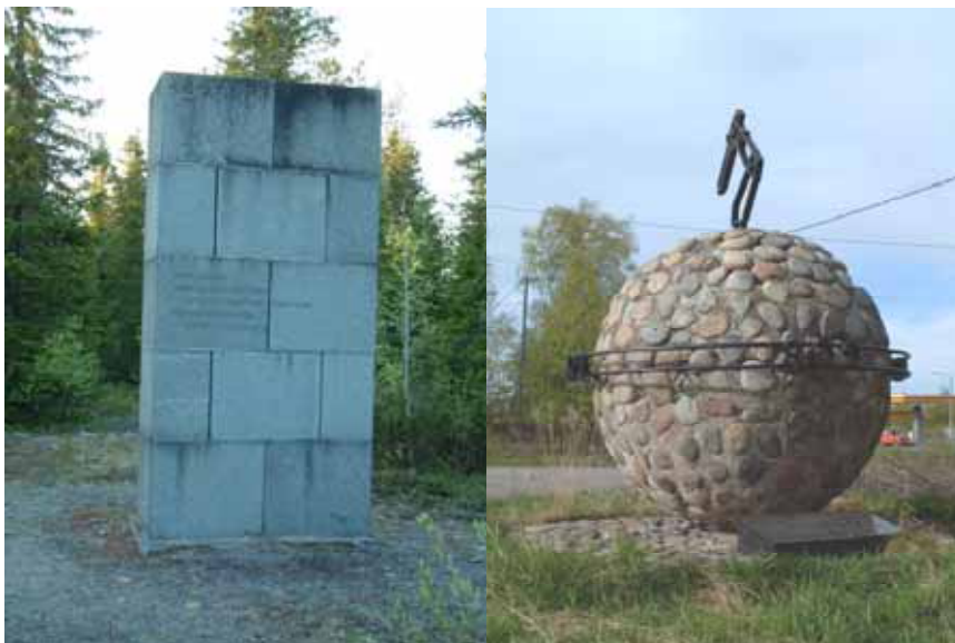
Virkamaan ja Elsanvainion joukkohaudat ovat Tornion seudun suurimpia.