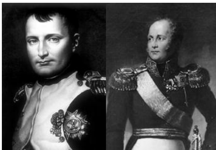
Napoleon ja Aleksanteri I sanelivat Euroopan politiikan askelmerkit Tilsitissä 1807.

Suomen sota liittyy osaltaan Ranskan vallankumousta seuranneiden sotien aiheuttamaan myllerrykseen. Voitokas Ranskan keisari Napoleon oli Tilsitin kaupungissa vuonna 1807 vaatinut Venäjän tsaaria, Aleksanteri I :stä painostamaan Ruotsia yhtymään Englannin vastaiseen kauppasaartoon. Ruotsi oli eräs Englannin merkittävimpiä kauppakumppaneita ja Ruotsista ostettu terva suoranaisesti Englannin laivaston merikelpoisuuden tae. Kauppasuhteisiinsa vedoten Ruotsi kieltäytyi rohkeasti kauppasaarrosta. Tämän jälkeen Venäjä aloitti varustautumisen sotaan. Ruotsi sitoi voimansa etelässä Tanskan ja Norjan suuntaan, eikä osannut varautua riittävällä tavalla mahdolliseen venäläishyökkäykseen.