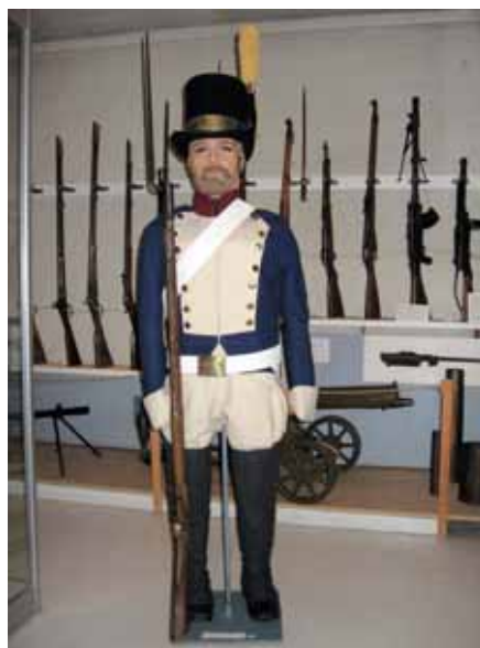
Länsipohjan rykmentin soturi. TLMM.

Tornionseudun miehet palvelivat Länsipohjan rykmentin majurin komppaniassa, jota kutsuttiin myös Tornion komppaniaksi. Pohjanmaalle perääntyneet joukot ryhmiteltiin keväällä 1808 uudelleen. Tuolloin muodostettu 5. prikaati sai komentajakseen eversti Sandelsin . Pohjanmaan ja Länsipohjan miehistä sekä Savon ja Karjalan jääkäreistä koostunut Sandelsin prikaati menestyi mm. Revonlahden ja Siikajoen taisteluissa. Tämän jälkeen prikaati lähetettiin takaisin puhdistamaan Savo. Ilmeisesti Tornion komppania liittyi tässä vaiheessa taistelujoukkoihin. Kuopio vallattiin 12.5. ja joukot etenivätkin kesäkuuhun mennessä aina Juvalle asti. Venäläiset onnistuivat kuitenkin lisäjoukkojen avulla valtaamaan Kuopion takasin.