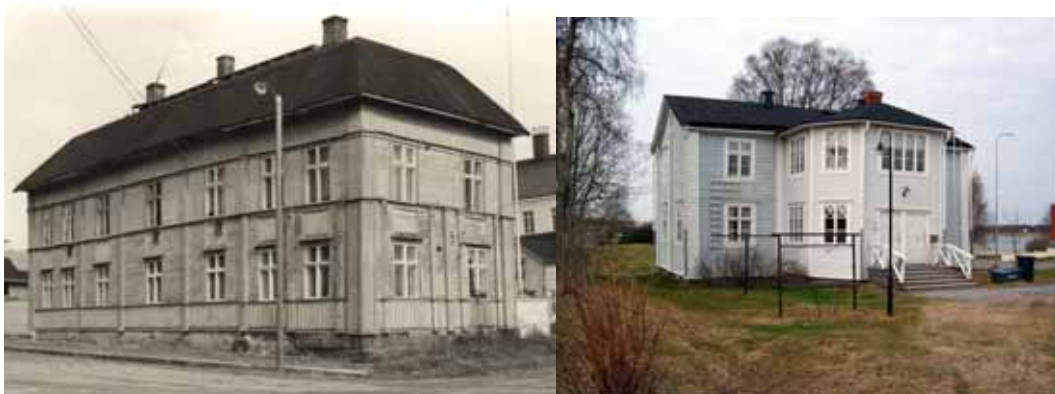
Perimätiedon mukaan kenraaliadjutantti Adlercreutz piti majaansa ns. Ahon talossa (purettu 1973) ja joulukuussa kenraalimajuriksi ylennetty Sandels Nymanin talossa, joka kuvassa on nykyisessä asussaan.

Olkijoen aselepo 19.11.1808 lopetti sotatoimet Suomen alueella. Armeija vetäytyi Ruotsin puolelle vanhan maakuntarajan länsipuolelle. Ruotsissa käytiin vielä jonkin verran taisteluja seuraavan vuoden puolella; (viimeiset Sävarissa ja Ratanissa 19-20. elokuuta 1809.) . Jo matkan aikana menehtyi runsaat 200 miestä. Myös suuri määrä hevosia ja varusteita jouduttiin jättämään matkan varrelle. Tornion seudulle saavuttiin joulukuun alkupuolella. Viimeinen yksikkö ylitti Kaakaman rajalinjan 13.12.1808. Armeijan saavuttua Tornioon kaikki Ruotsissa kootut yksiköt kotiutettiin ja vain suomalaiset sotilaat jäivät vartioimaan demarkaatiolinjaa. Suomen sotaa käynyt armeija organisoitiin uudelleen tammikuussa 1809 ja sitä alettiin kutsua Pohjoiseksi armeijaksi. Siihen kuului kaksi divisioonaa: 1. suomalainen divisioona ja 2. ruotsalainen divisioona. Suomalaisen divisioonan neljästä prikaatista kaksi siirrettiin etelämmäs ja kaksi määrättiin vartioimaan aselepolinjaa.