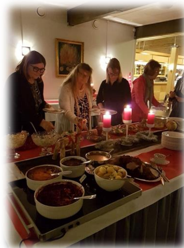
Kuvat: Tornion kansalaisopiston, Meän Opiston ja Kivalo-opiston yhteinen työhyvinvointipäivä Ylitornion Lomakeskus Karemajoilla.