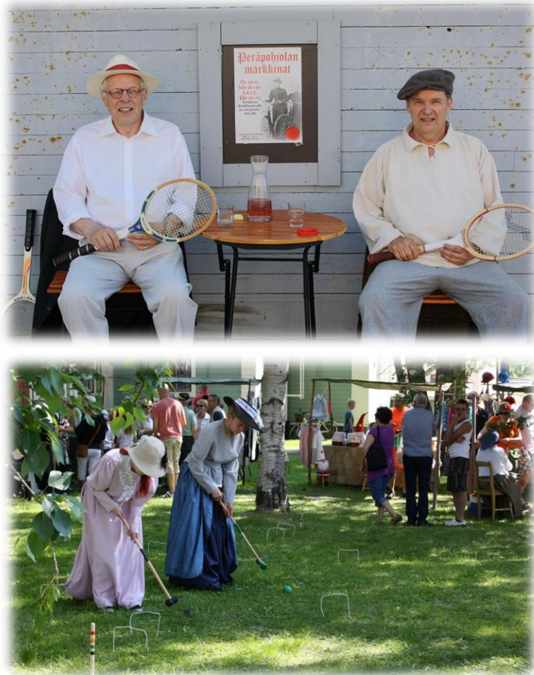
Kuva: Markkina-alueella pelattiin myös krockettia ja tennistä.