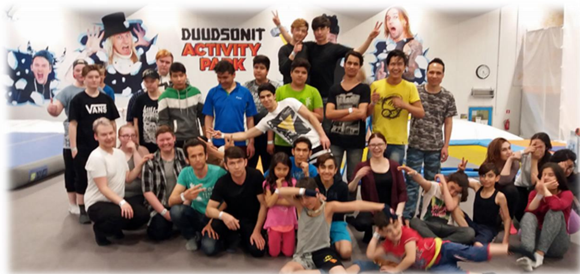
Kuva: Maahanmuuttajat tutustumassa Duudson Parkin toimintaan