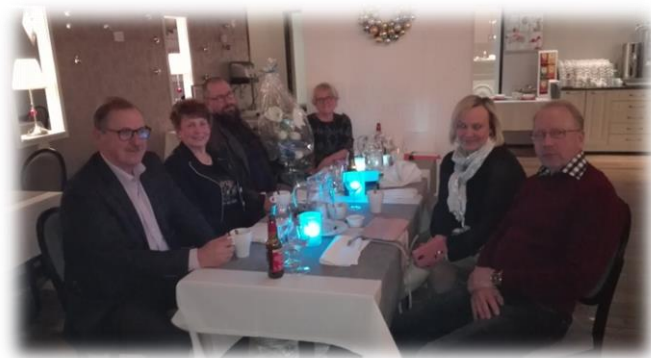
Kuva: Englannin opiskelijoita pikkujoulun vietossa.

Kielten yksikön toimintaan jo vakiintuneet opinto- ja kulttuurimatkat saavat kuluvana vuonna jatkoa. Vuonna 2017 kieltenopettajat vetivät henkeä ja ovat nyt uudella innolla lähdössä opiskelijoidensa kanssa tutustumaan opettamansa kielen kohdemaahan: toukokuussa ryhmä englannin opiskelijoita suuntaa USA:n Isoon Omenaan ja kesäkuussa ryhmä espanjan opiskelijoita matkaa Gaudin arkkitehtuurista kuuluisaan Barcelonaan.