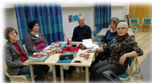
Kuvat: Herkuttelua englannin ryhmässä ennen joulutaukoa.