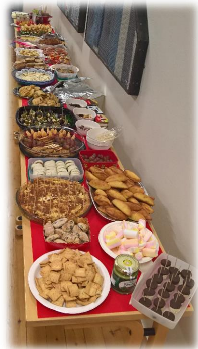
Kuvat: Englannin opiskelijoita työn touhussa joulun alla. Oikealla: Espanjan opiskelijoiden Tapas-illan tarjoilua