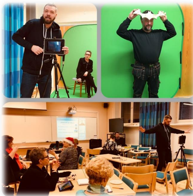
Kuvat: Kuvaus ja editointi mobiililaitteella -koulutustilaisuus.