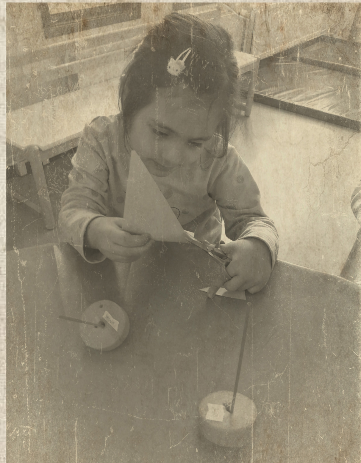
Laivat askarrettiin kelluviksi ja koreat purjeet vedettiin mastoihin. Kyllä näiden laivojen kelpaa seilata maailman meriä.

Niin se oli, että Tornioista oli vilja loppumassa eikä Ellalla ollut enää jauhoja, joista leipoa leipää. Kaupunkilaiset olivat nälkäisiä ja sen vuoksi vihaisia. Jotain asialle täytyi tehdä, pohti itse Iisakki Mustaparta. Iisakilla oli maatila, mutta ei omaa laivaa. Hän tarvitsee sellaisen laivan, jossa on suuret purjeet ja kansi. Asiasa oli vain yksi suuren suuri ongelma. Nimittäin Tornion hurja pormestari oli kieltänyt uusien laivojen rakentamisen. Iisakki oli rohkea mies ja päätti ystäviensä kanssa rakentaa laivan. Hänen ystävänsä