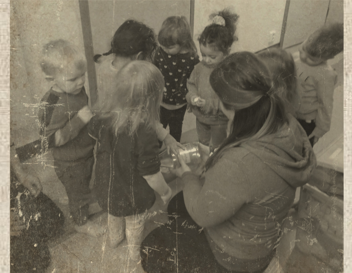
Kertut ihmettelee jokeen eksynyttä pullopostia