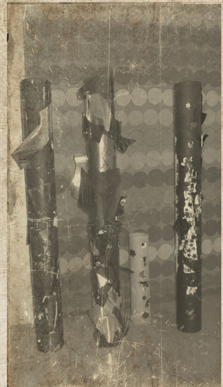
Osastoilla askarreltiin kaukoputkia joilla pystyi tarkastelemaan aarresaaria ulapalla.

kantta pitkin. Aallot heiluttivat hurjasti laivaa ja kannella holtittomasti liikkuva ankkuri oli erittäin vaarallinen. Ankkuri oli yllättäen kannella horjatelevan Iisakin, mutta onneksi Ella nykäisi hänet turvaan viime hetkellä. Ella oli neuvokas naimen ja haki nopeasti kalaverkon. Kalaverkolla hän nappasi ankkurin kiinni. Iisakki kiitteli vuolaasti Ellaa avusta. "Mitäs tuosta. Aamulla mie piän koko miehistölle kunnan solmukoulun, ettei vastaavaa enää tapahdu!" ilmoitti Ella hymyssä suin. Myrsky laantui ja Tukholma siinsi horisontissa. Heidän laivansa ja kallisarvoinen tervalastinsa oli selvinnyt myrskystä.