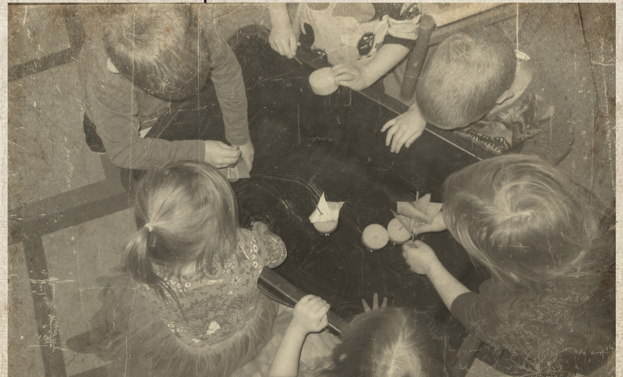
Hienosti kelluivat myös Peippojen laivat.