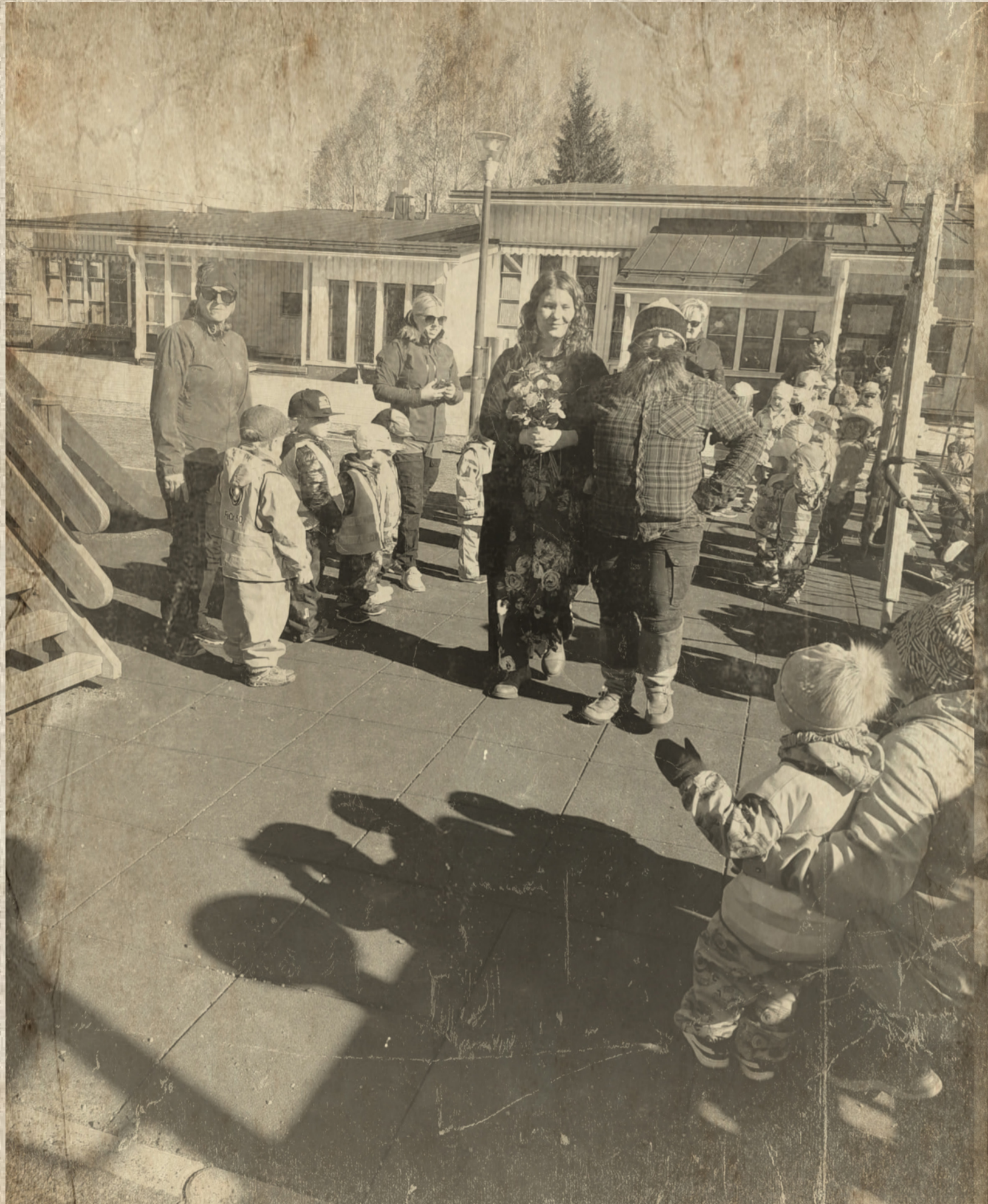
Tapahtuma huipentui Mustaparran häihin. Häitä vietettiin koko päiväkodin voimin ulkona.

Suuri merimatka oli takana, gas Kustaa kolmas päät- koko kaupungilla oli vilja- ti myös jäädä viettämään varastot täynnä ja Iisakki häitä. Ella ompeli itselleen oli vapautettu. Nyt on aika kauniin häämekon. Iisak- järjestää häät! Kaupunkilai- ki laittoi merimiesasun yl- set kokoontuivat auttamaan leen. Herra Hellantti toimi järjestelyissä. Itse Kunin- vihkijänä. Häät päätettiin pitää möljällä ja vihkimin- en tapahtui, missäs muualla- kaan, kuin heidän laivassaan. Päivä oli täynnä ilon kyyne- leitä, tanssia, laulua ja naurua. Sitten he elivät onnelisi- na elämänsä loppuun asti.