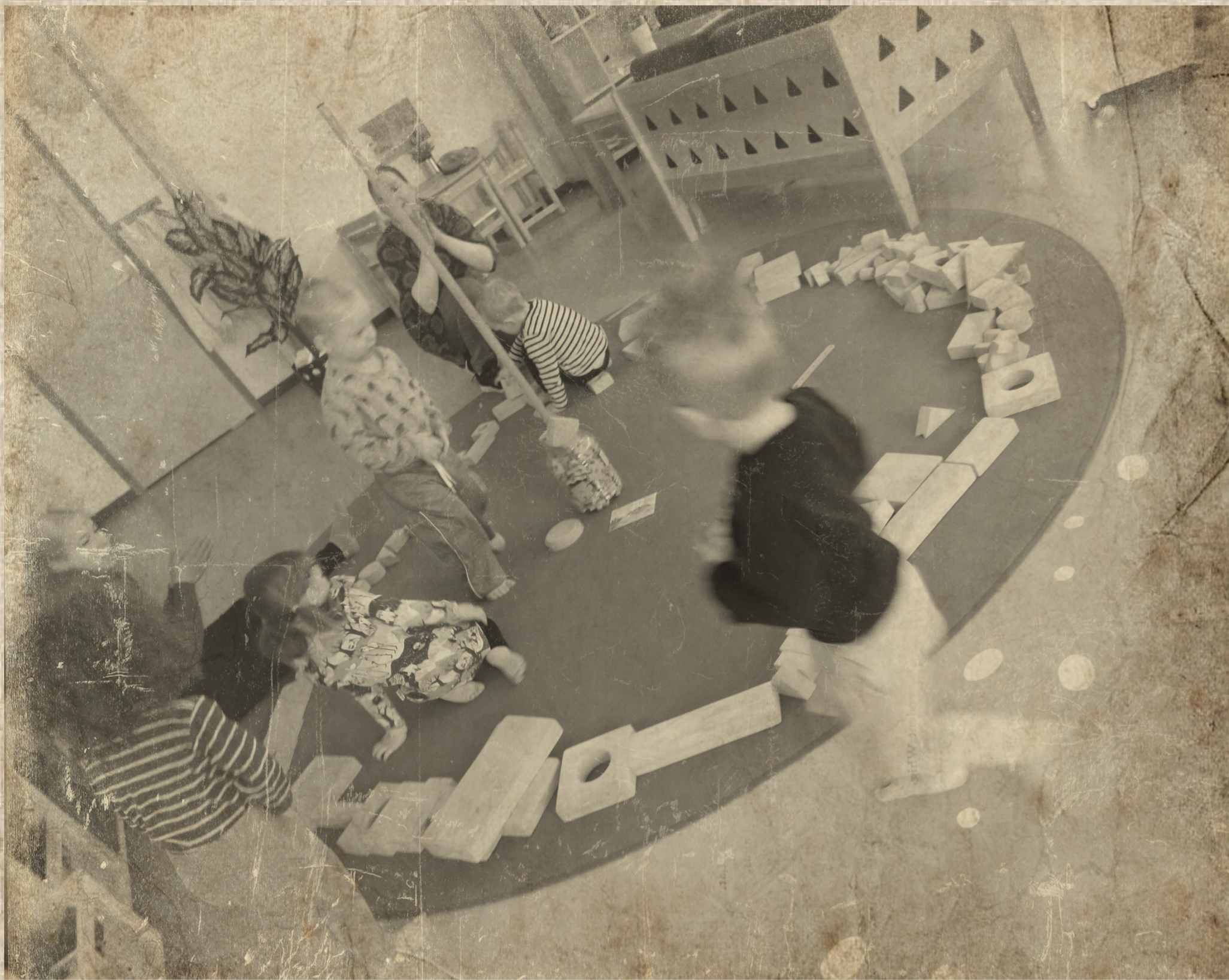
Kertut tekivät tervapadan jumpalla vaihe vaiheelta. Lopuksi saatiin tervaa, jota tuokseteltiin ja leikisti tervasimme laatikkolaivaa.