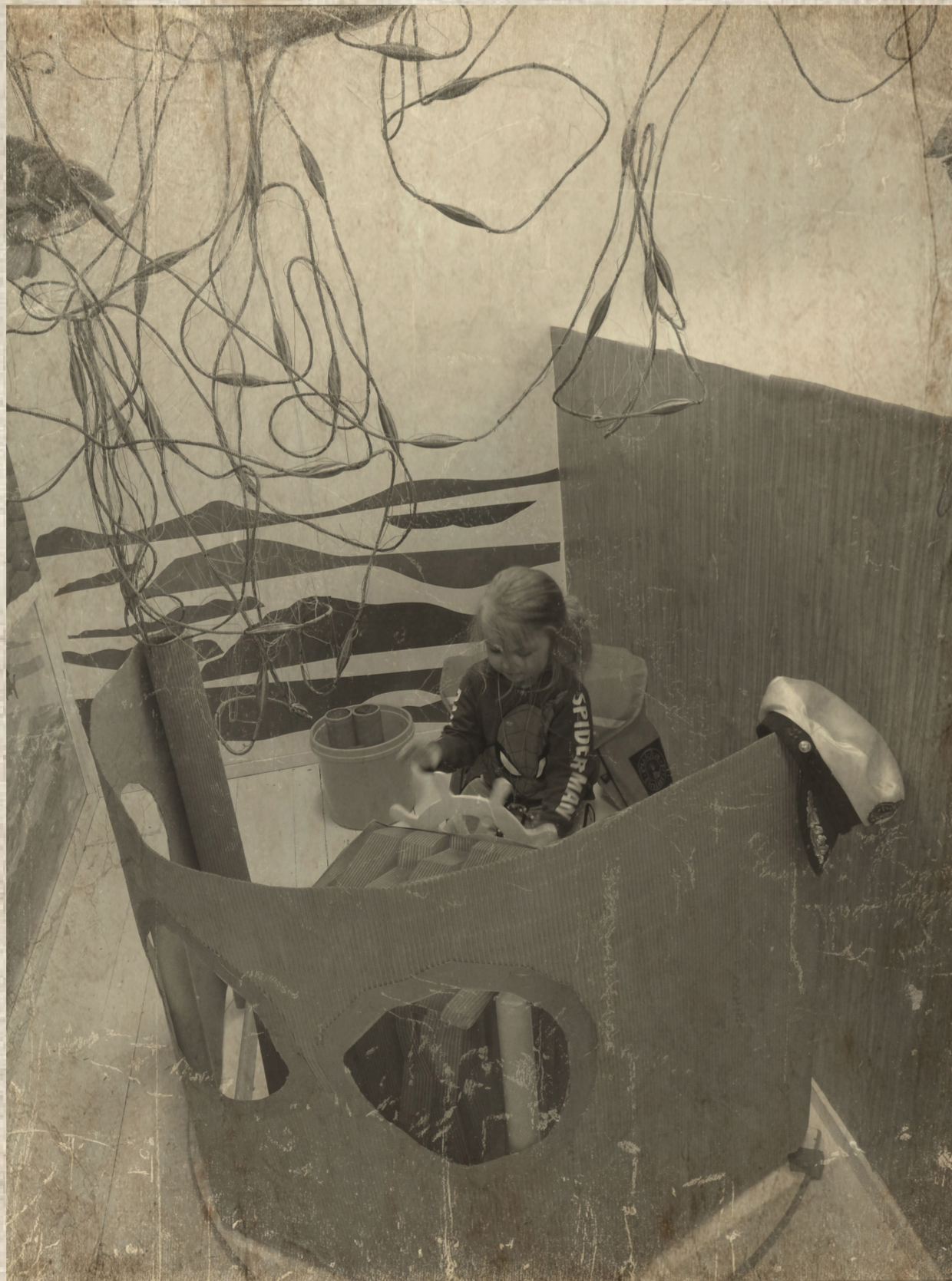
Päiväkodin laivassa oli kaikkien lasten mahdollista kokea Mustaparran meriseikkailu.

tohvelit yllään. Hänen ilmeensä oli aikamoinen. Naama muuttui punaiseksi ja hän hyppeli laiturilla tasajalkaa. "Tästä te ette selviää!" kiljui hän punakana laivan miehistölle. Iisakki miehistöineen meinasi tikahtua nauruun, oli hän niin hassu ilmestys. Laiva osoittautui todella hyväksi ja purjehtiminen oli