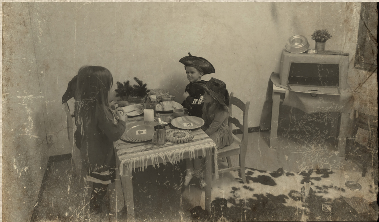
Ravintolaleikissä pystyi leikkimään ravintolanpitäjää sekä asiakkaita.

Miehistö saapui kuningas suuri, täynnä toinen to-Kustaa kolmannen koti- istaan hienompia laivoja. kaupunkiin Tukholmaan. Oikea suurkaupunki! Kaupungissa kuului jatkuva pu- tystä kerrakseen. Torniossa heensorina, kaduilla kulki kaikki talot olivat puutalo- ja. Tukholmassa talot oli saan ja miehiä puvuissaan. tehty kivistä. Satama oli puhuttiin