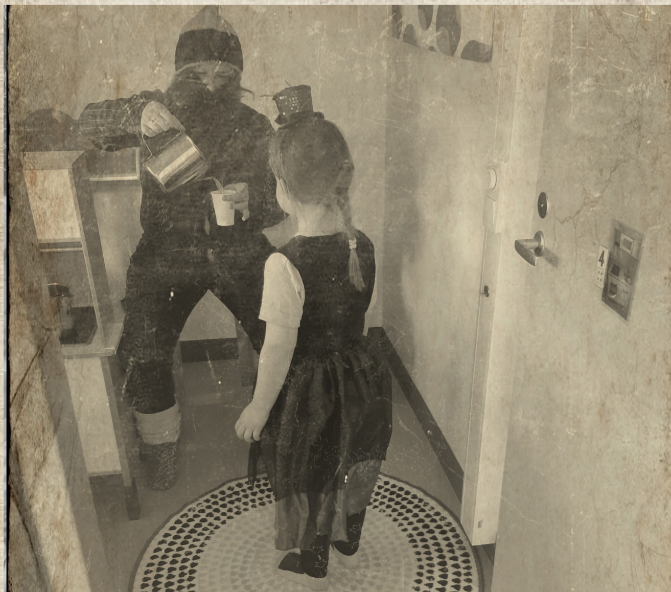
Mustaparran kahvilasta pystyi ostamaan monenlaisia herkkuja.

Miehistö saapui kuningas suuri, täynnä toinen to-Kustaa kolmannen koti- istaan hienompia laivoja. kaupunkiin Tukholmaan. Oikea suurkaupunki! Kaupungissa kuului jatkuva pu- tystä kerrakseen. Torniossa heensorina, kaduilla kulki kaikki talot olivat puutalo- ja. Tukholmassa talot oli saan ja miehiä puvuissaan. tehty kivistä. Satama oli puhuttiin