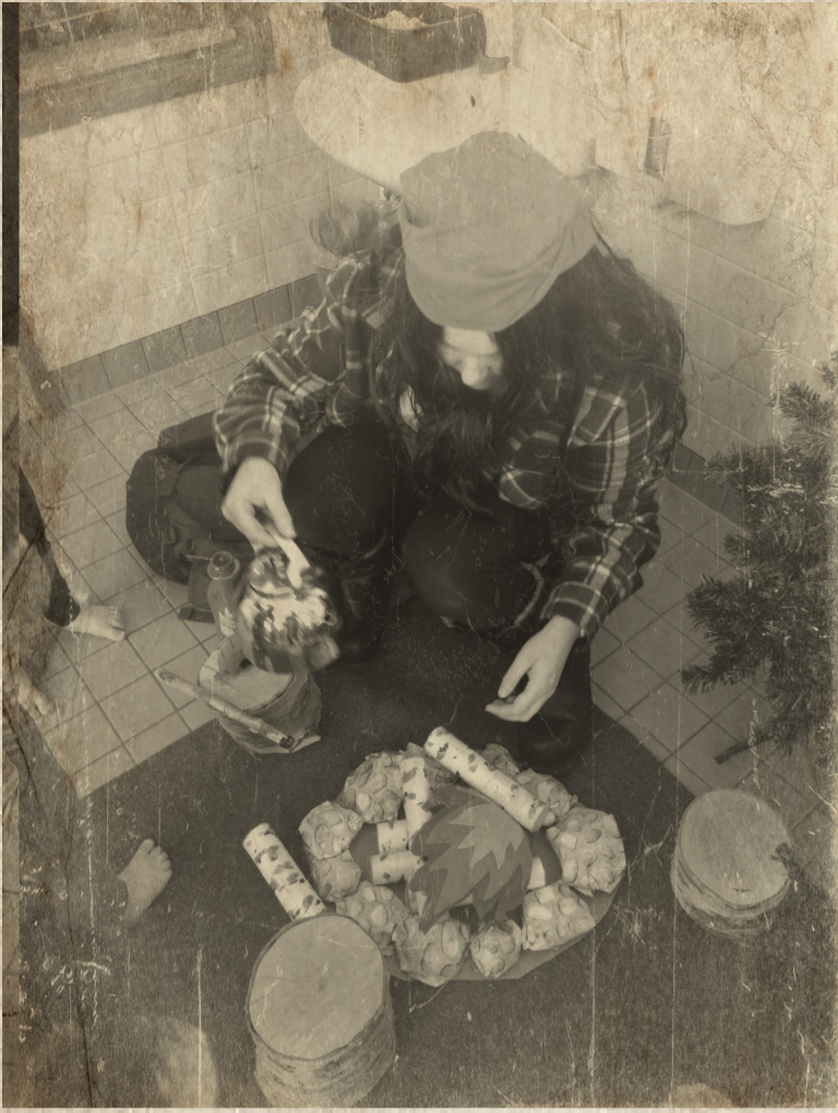
Mustaparta kävi retkellä Kerttujen kanssa. Nokipannukahvit ja makkarat nautittiin nuotion äärellä

Tämän tarinan päähahmo on hurjan rohkea mies nimeltään Iisakki Mustaparta. Hän on pitkä, voimakas ja nimensä mukaisesti parrakas mies. Luonteeltaan hän on rauhallinen, päättäväinen ja seikkailun nälkäinen. Punainen huivi hänellä on kaulassaan, sininen pitkä takki yllään ja ruskeat saappaat jalassaan. Hän on seilannut maailman merillä ja kohdannut monia seikkailuja. Hän on luotettava ystävä ja neuvokas toimissaan. Hän puolustaa heikompia ja auttaa hädässä olevia. Kaupunkilaiset kuvailevat häntä iloiseksi ja avuliaaksi mieheksi. Muiden auttaminen tekee hänet iloiseksi ja hän on aina kaupunkilaisten puolella. Hän ei pidä pettureista, kiusaajista ja valehtelijoista. Suuttuessaan hän on erittäin vihainen, mutta leppyä saadessaan vilpittömän anteeksipyyntön. Iisakki viettää paljon aikaa Kievarissa. Miksikö? Haluatteko kuulla salaisuuden? Hän on salaa ihastunut Kievarin pitäjään Ellaan. Ja tykkää myös maittavasta ruuasta sekä saunomisesta.