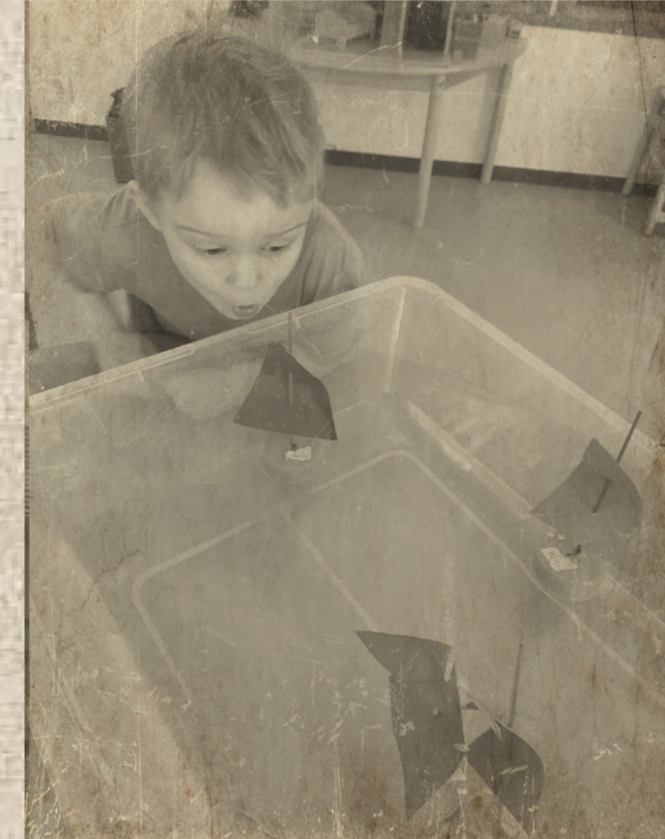
Vielä ku hieman vauhtia antaa niin kyllepäs laiva viilettää merellä.