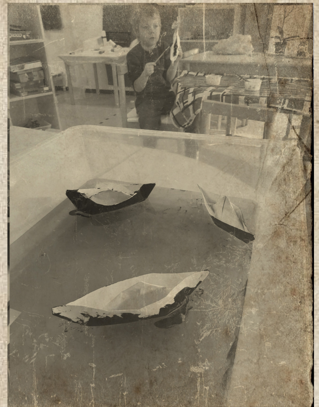
Tervatut laivat kelluivat hienosti.