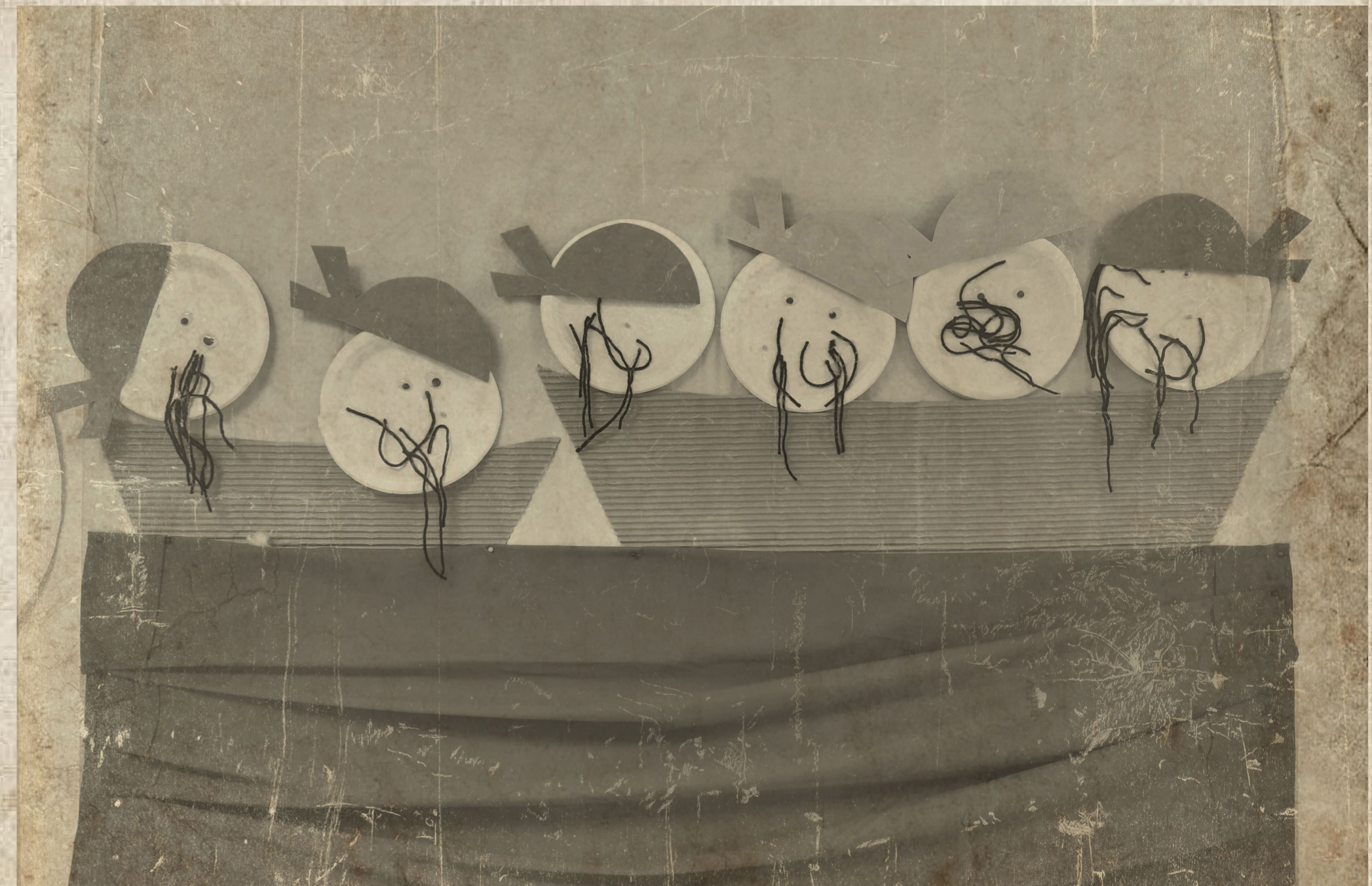
Sirkkujen näkemys Iisakki Mustaparrasta seilaamassa maailman merillä.