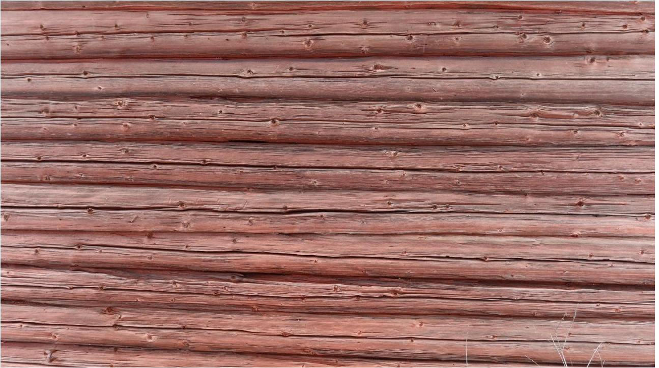
Perinteinen punamulta sopii hyvin hirsipinnalle