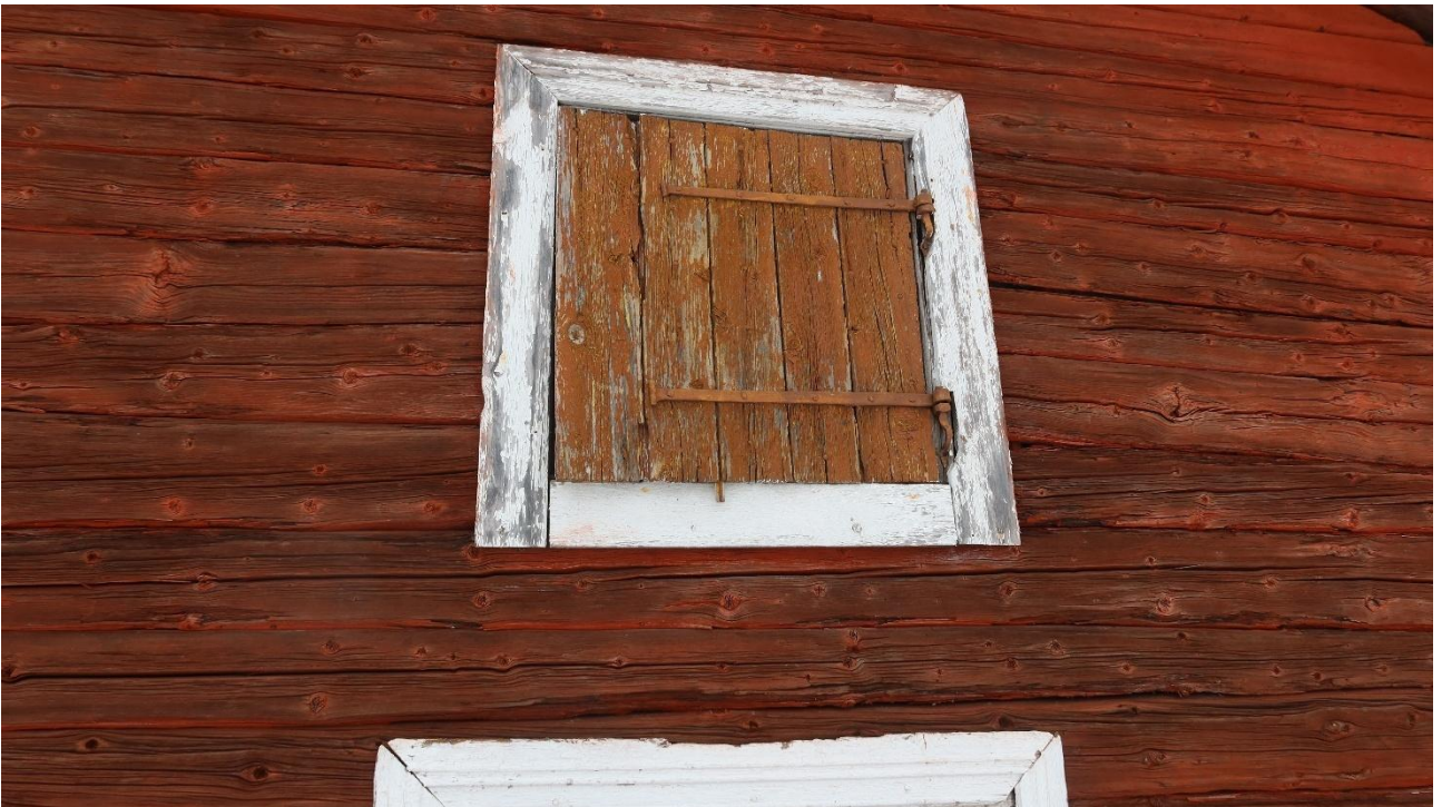
Ovet ovat aittojen tärkeitä yksityiskohtia