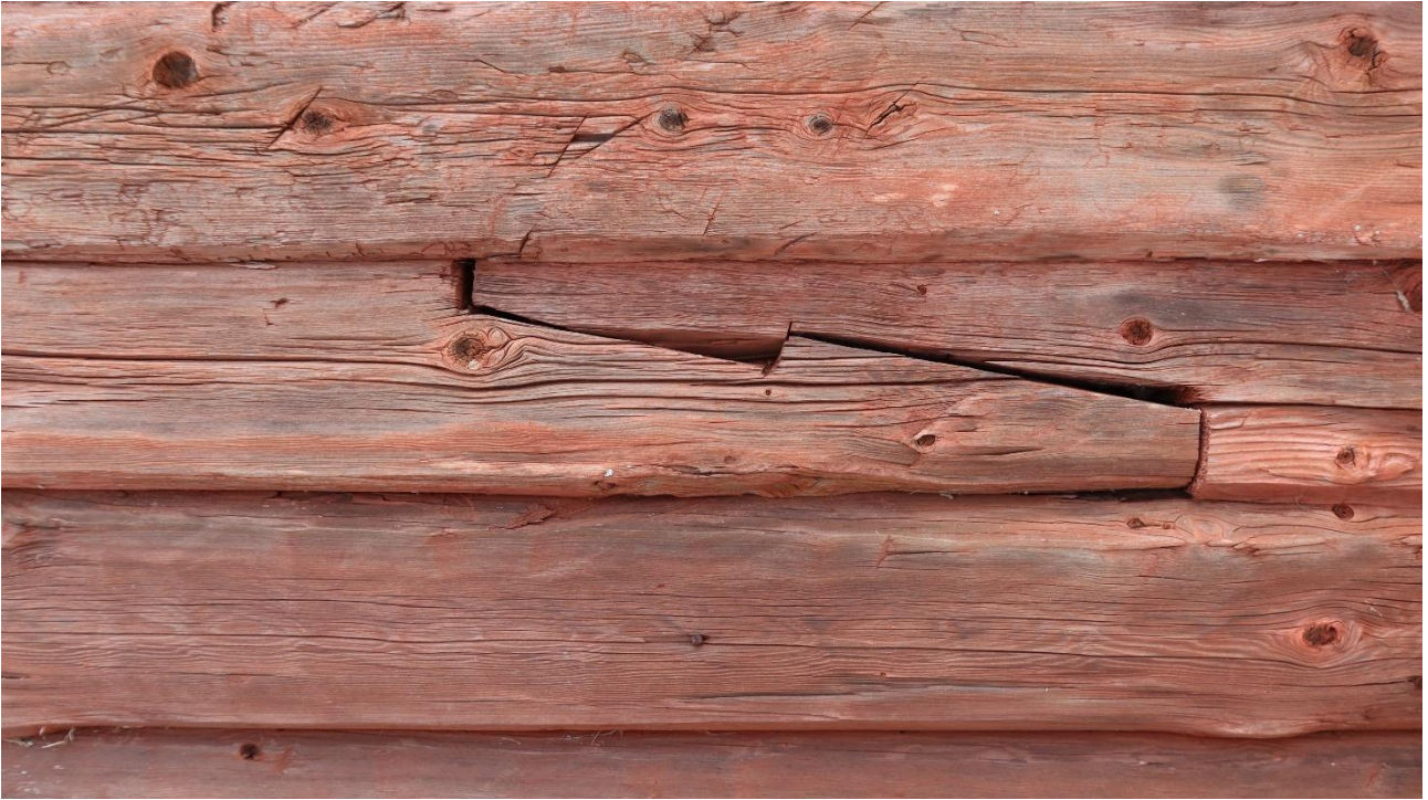
Hirsikorjaus hammaslapaliitoksella. Koko hirttä ei tarvitse aina vaihtaa.