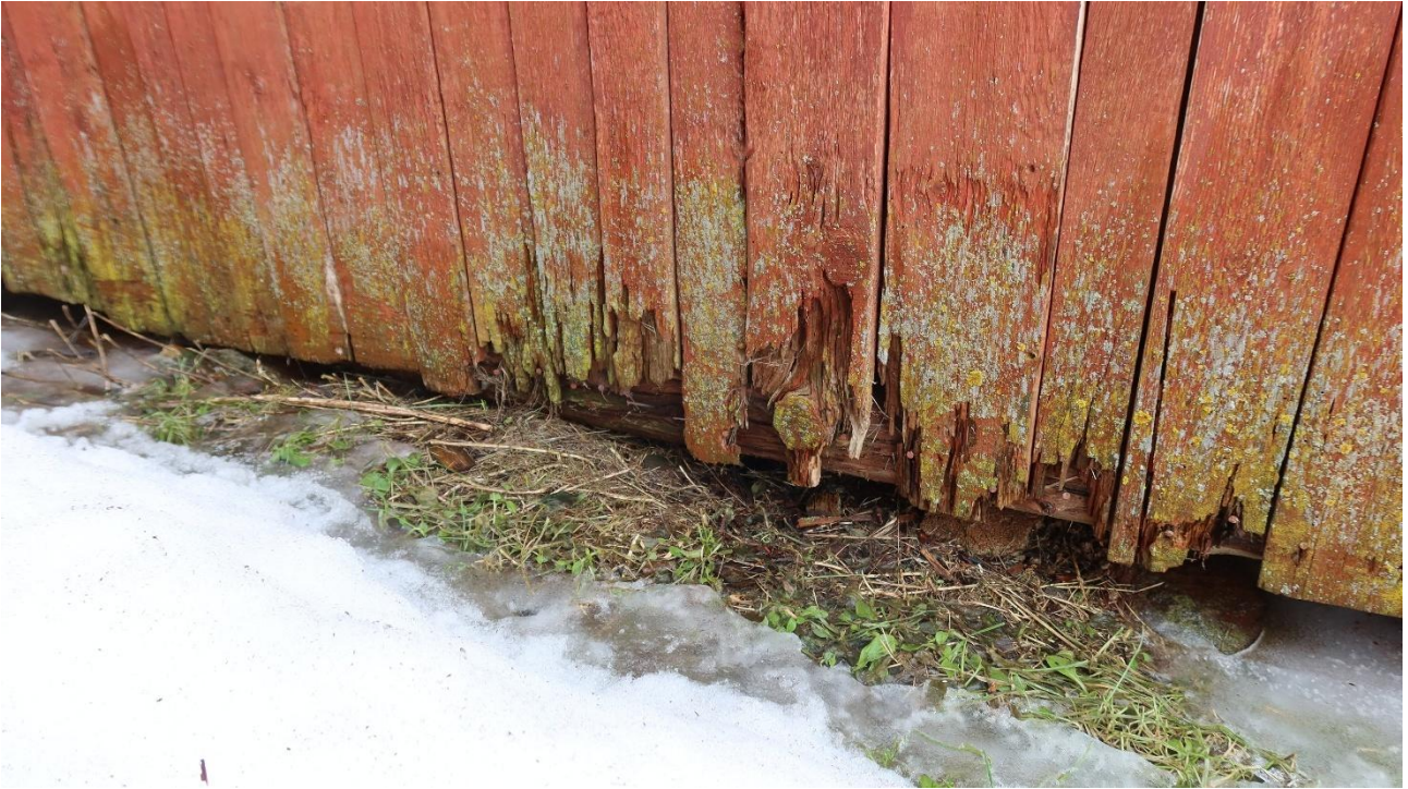
Vesi ja orgaaninen aine yhdessä estävät rakenteen kuivumista