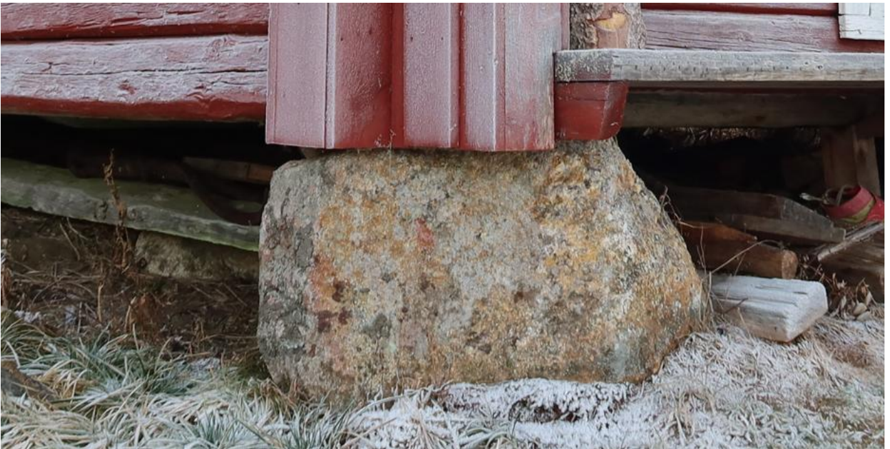
Luonnonkivet ovat hyviä nurkkakiviä