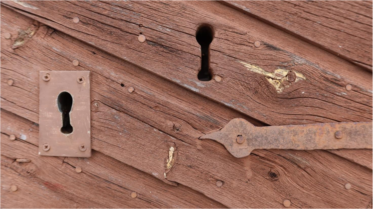
Ovien yksityiskohdat on syytä säilyttää