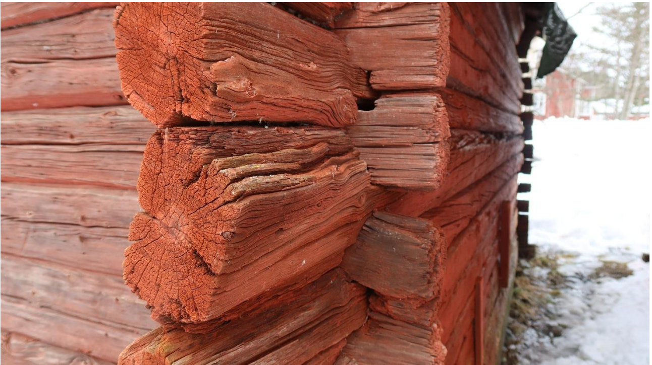
Salvosten lahoaminen aiheuttaa seinien pullistumista ja lopulta rakenteen pettämisen