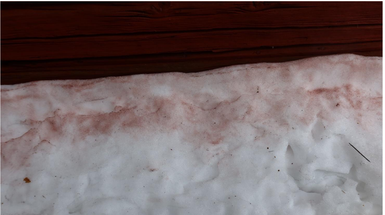
Punamultamaali irtoaa seinästä pölyämällä