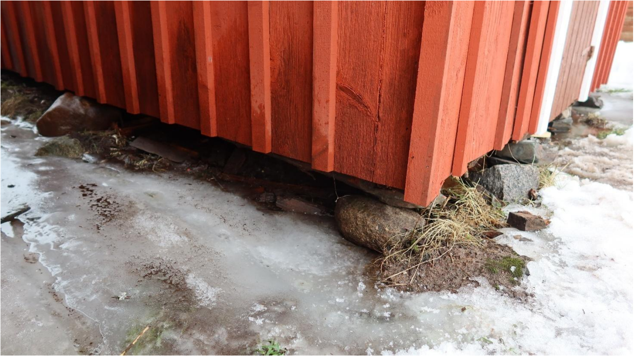
Riittävä etäisyys maanpinnasta estää lahovaurioita