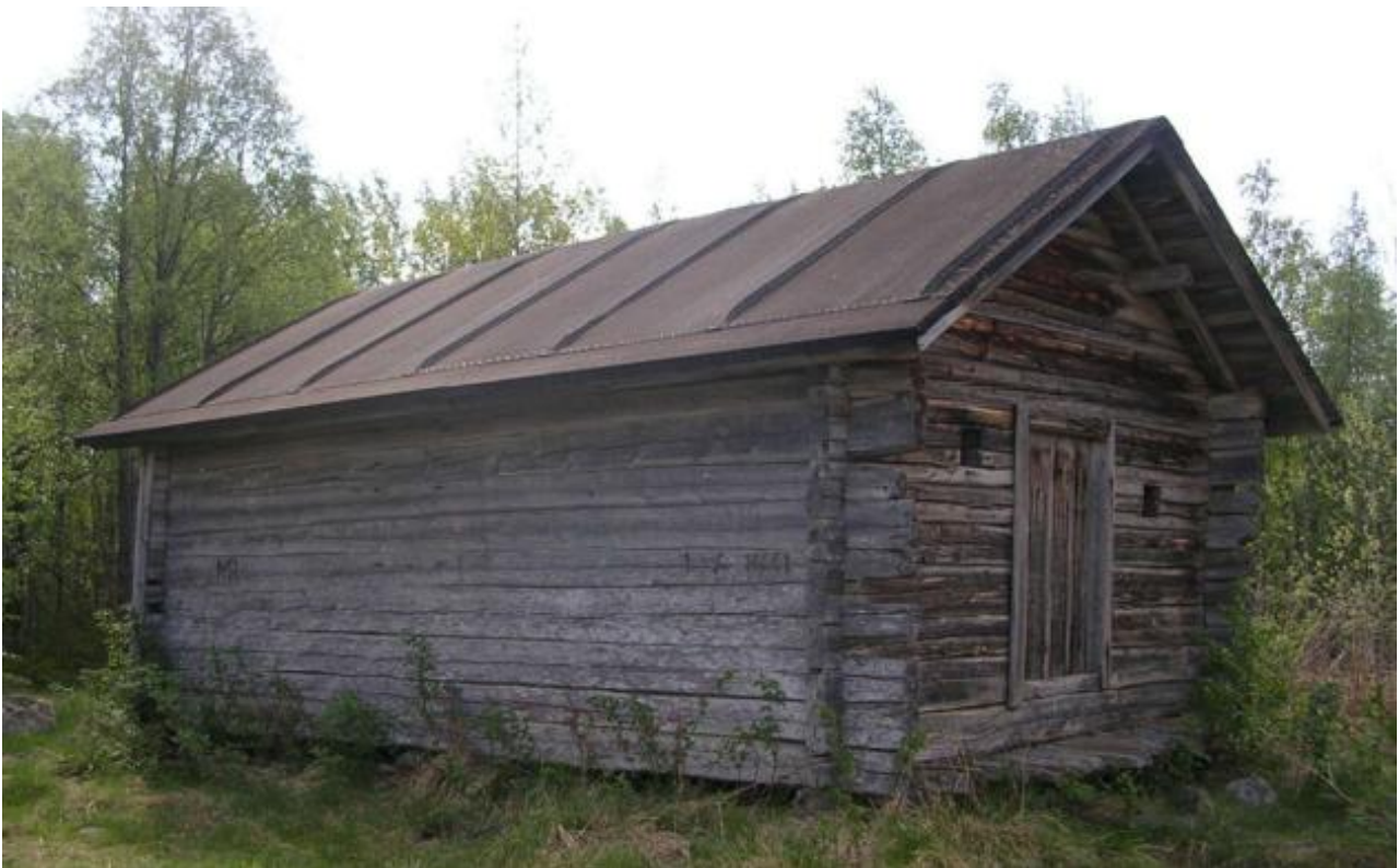
Kolmiorimakate on perinteinen huopakate