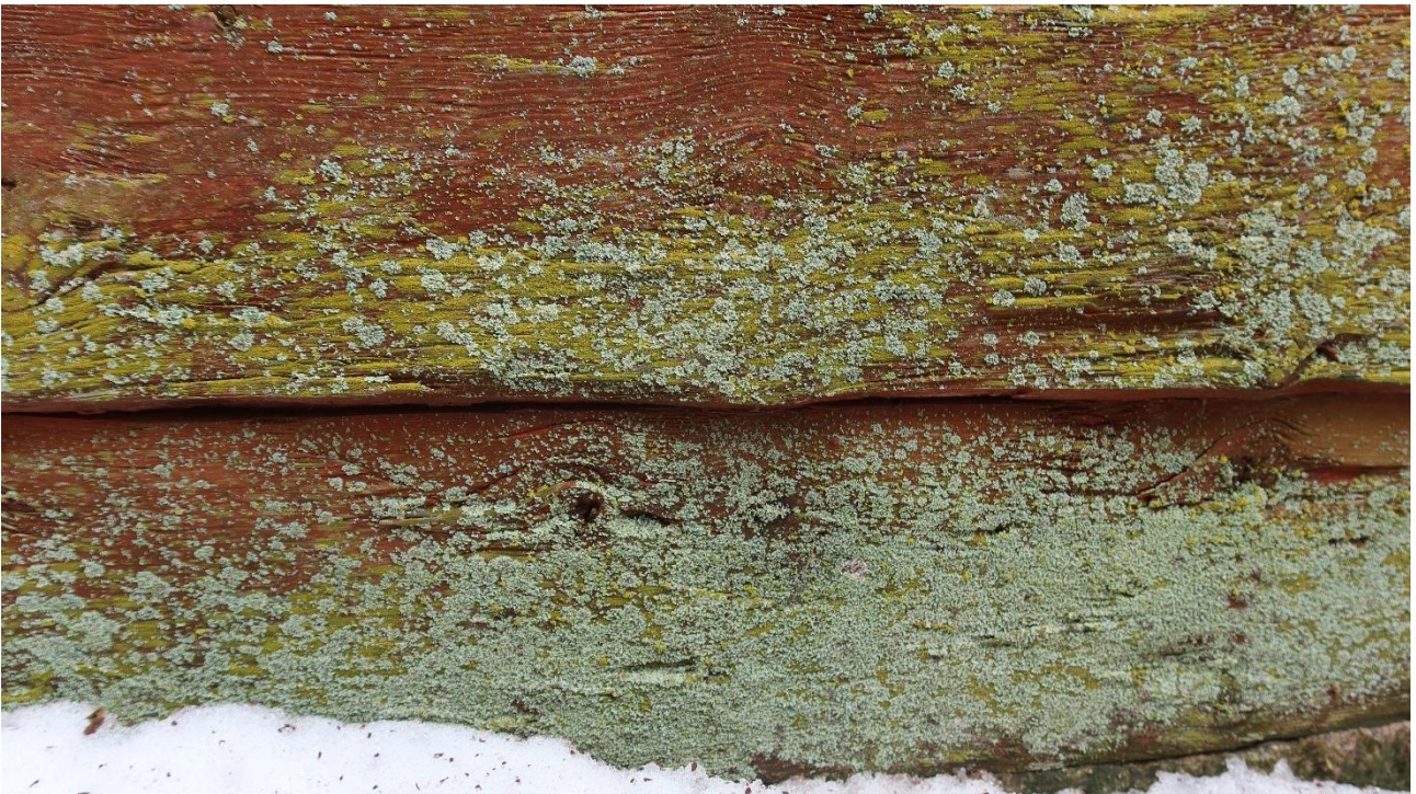
Sammalta ja jäkälää alimmissa hirsissä