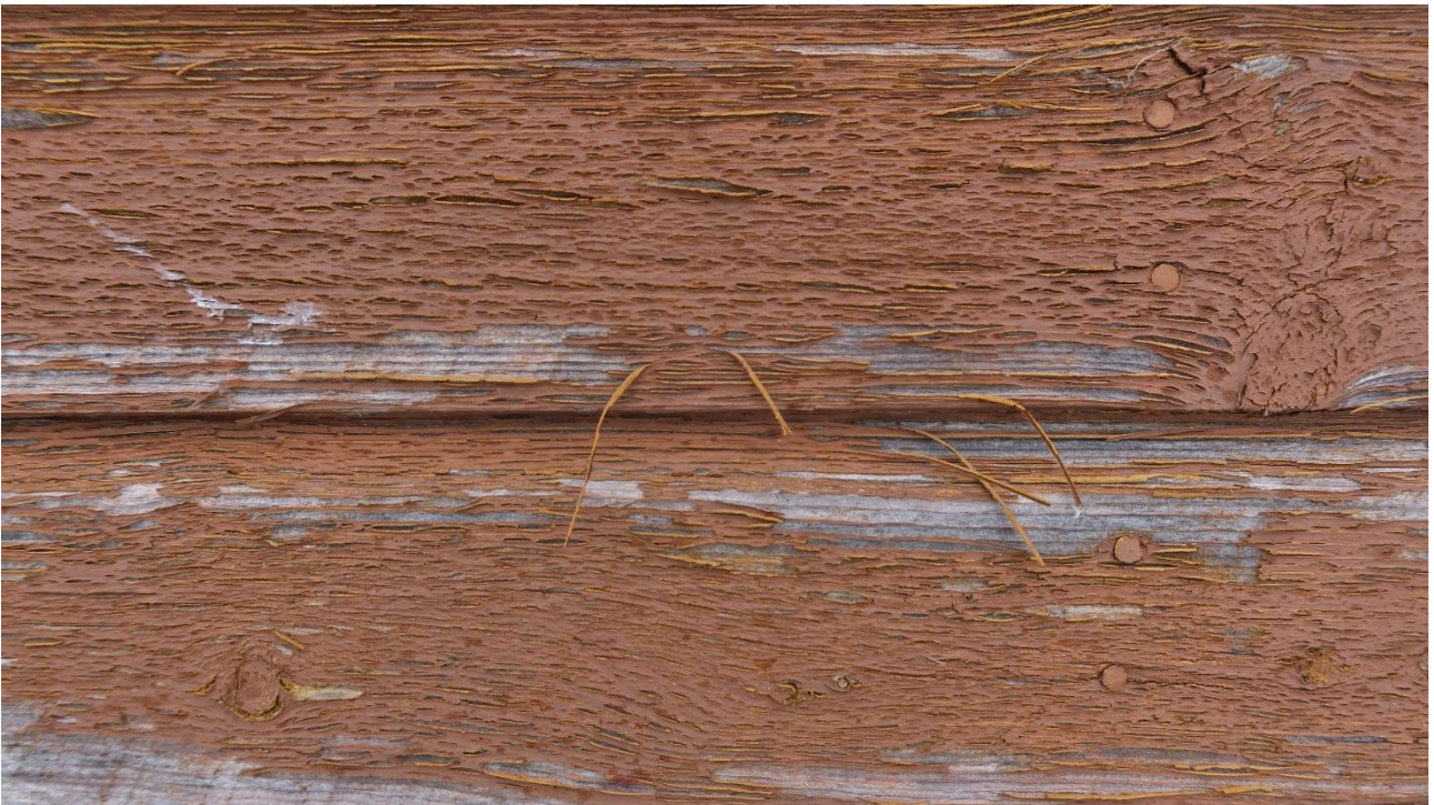
Lateksimaalit irtoavat taipuisina lastuina. Muovikalvo estää puuta kuivumasta.