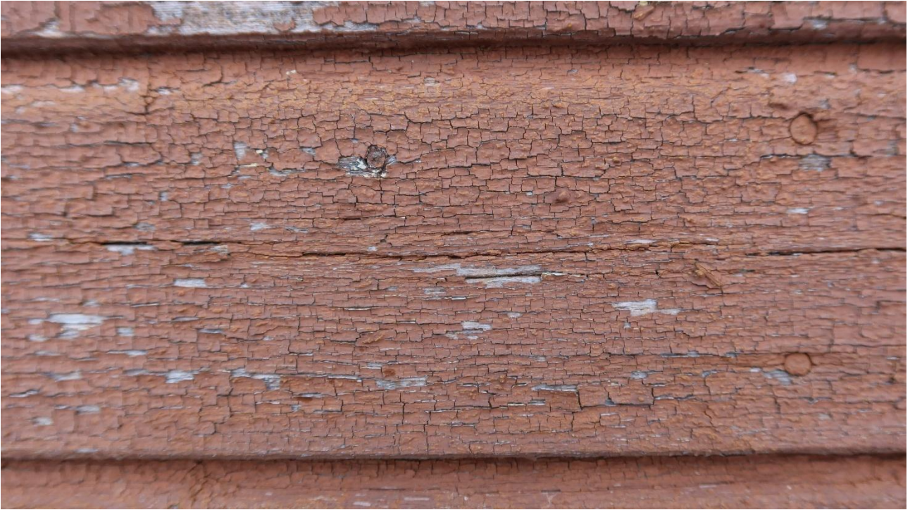
Kulunutta pellavaöljymaalilla maalattua pintaa