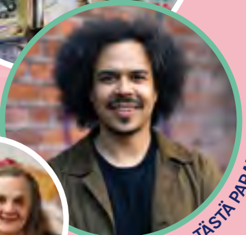
SUNKHAAN SE TÄSTÄ PARANE