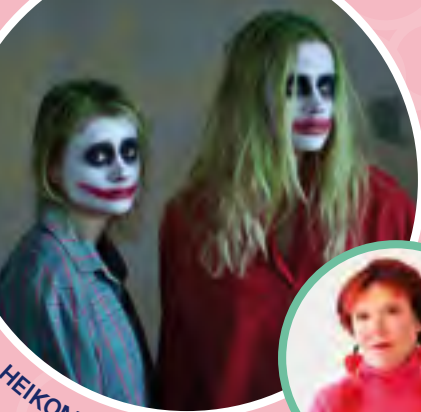
HEIKOMPAA JO HIRVITTÄÄ