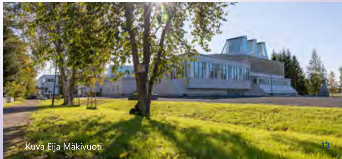
Kuva Eija Mäki vuoti