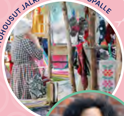
LUOVUUS KUKKII - TULE JA TEE